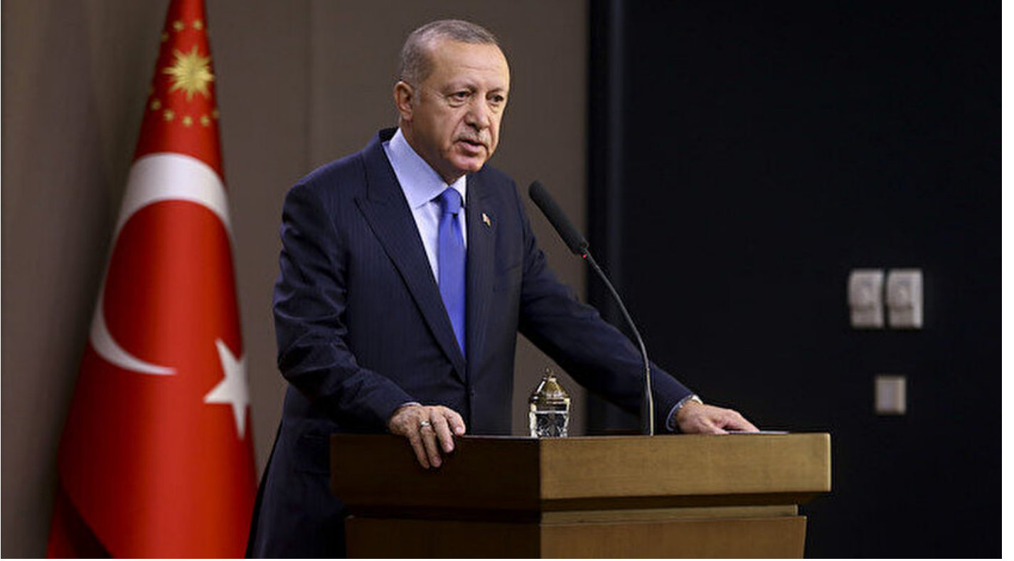
Cumhurbaşkanı Recep Tayyip Erdoğan