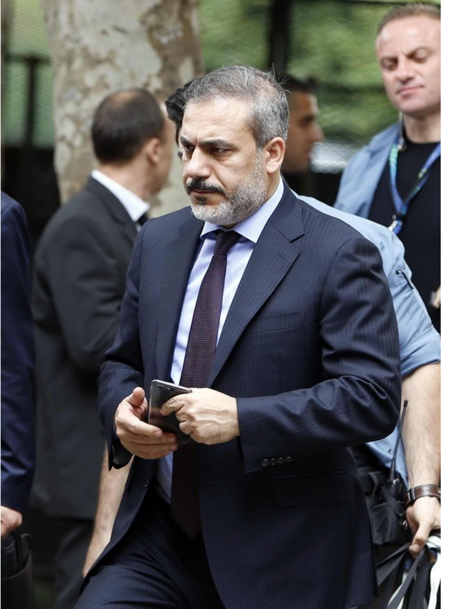
Hakan Fidan MİT'te büyük FETÖ temizliği yaptı.