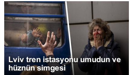
Lviv tren istasyonu umudun ve hüznün simgesi