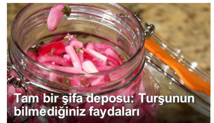
Tam bir şifa deposu: Turşunun bilmediğiniz faydaları