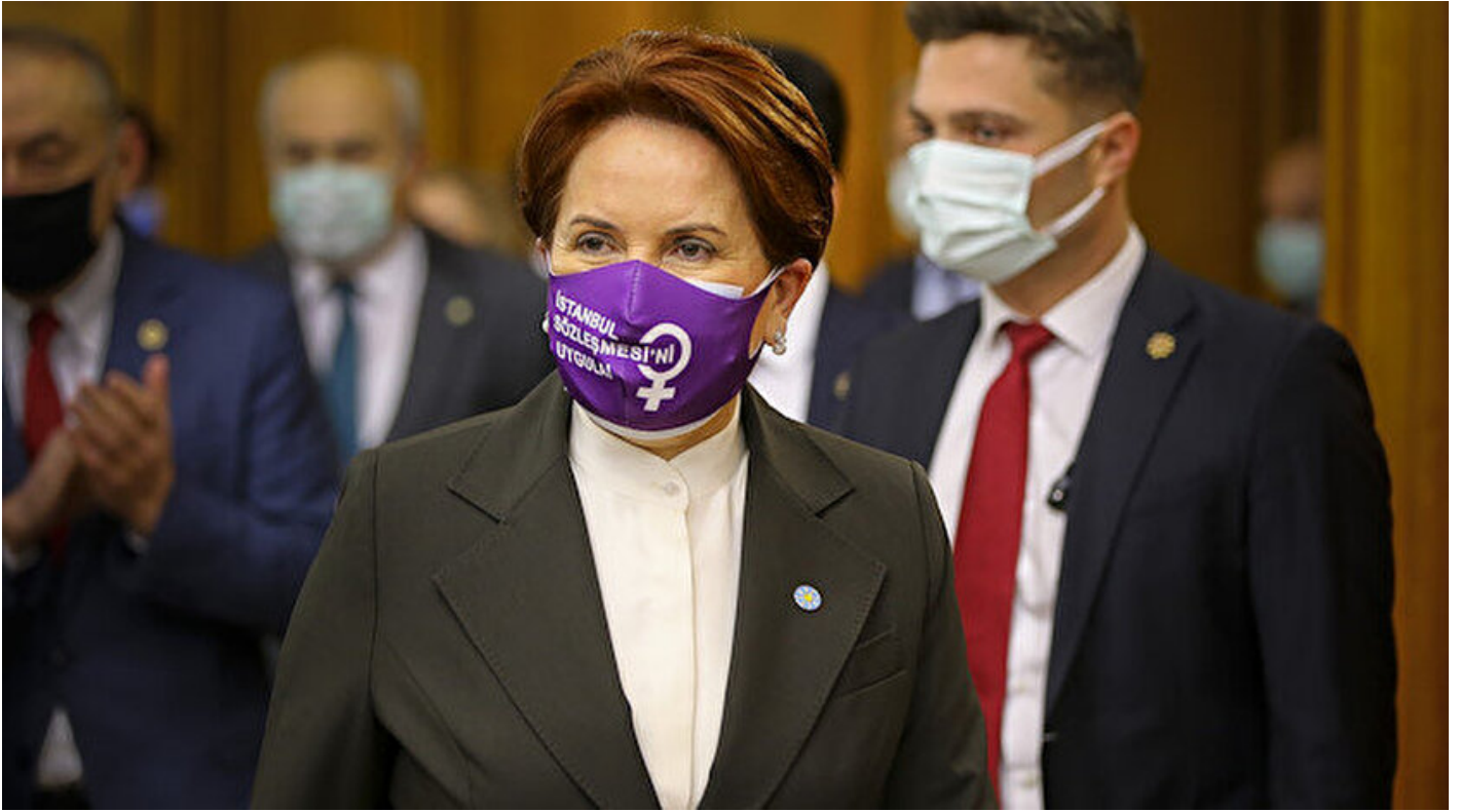
İyi Parti Genel Başkanı Meral Akşener