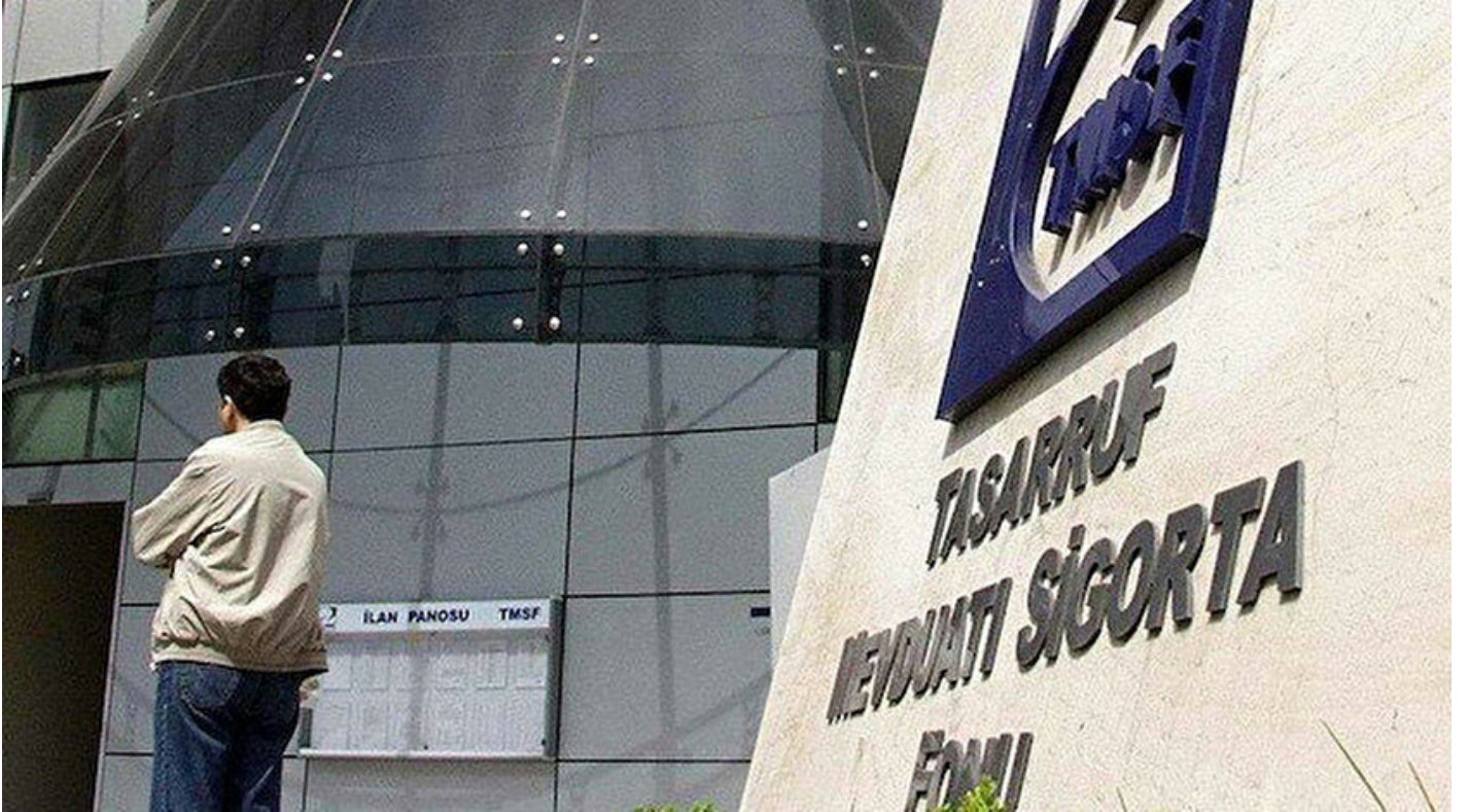
Tasarruf Mevduatı Sigorta Fonu

Haber Merkezi • 16 Eylül 2019, 15:31 • Son Güncelleme: 16 Eylül 2019, 15:39 • AA