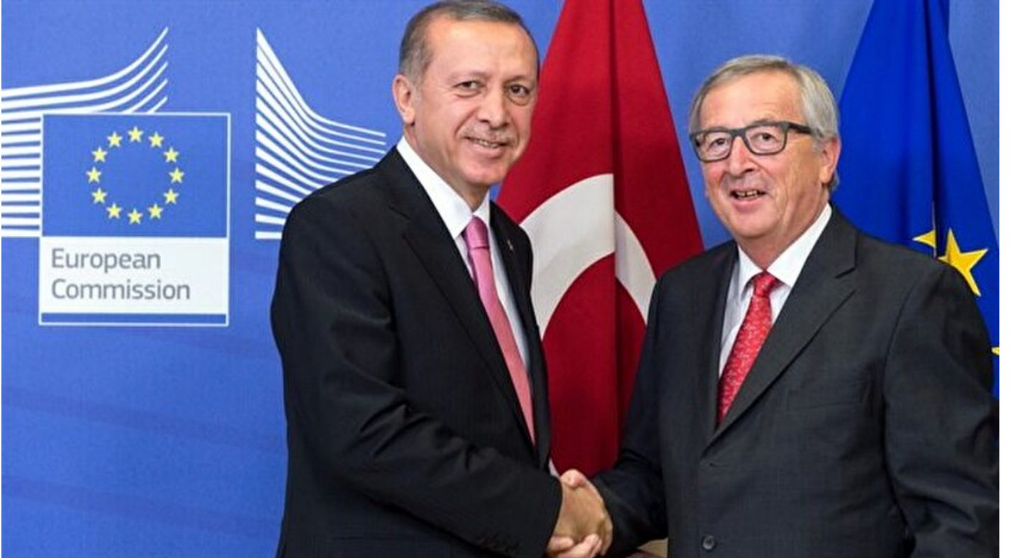
Cumhurbaşkanı Recep Tayyip Erdoğan-AB Komisyonu Başkanı Jean-Claude Juncker

Haber Merkezi · 27 Temmuz 2016, 08:53 · DHA