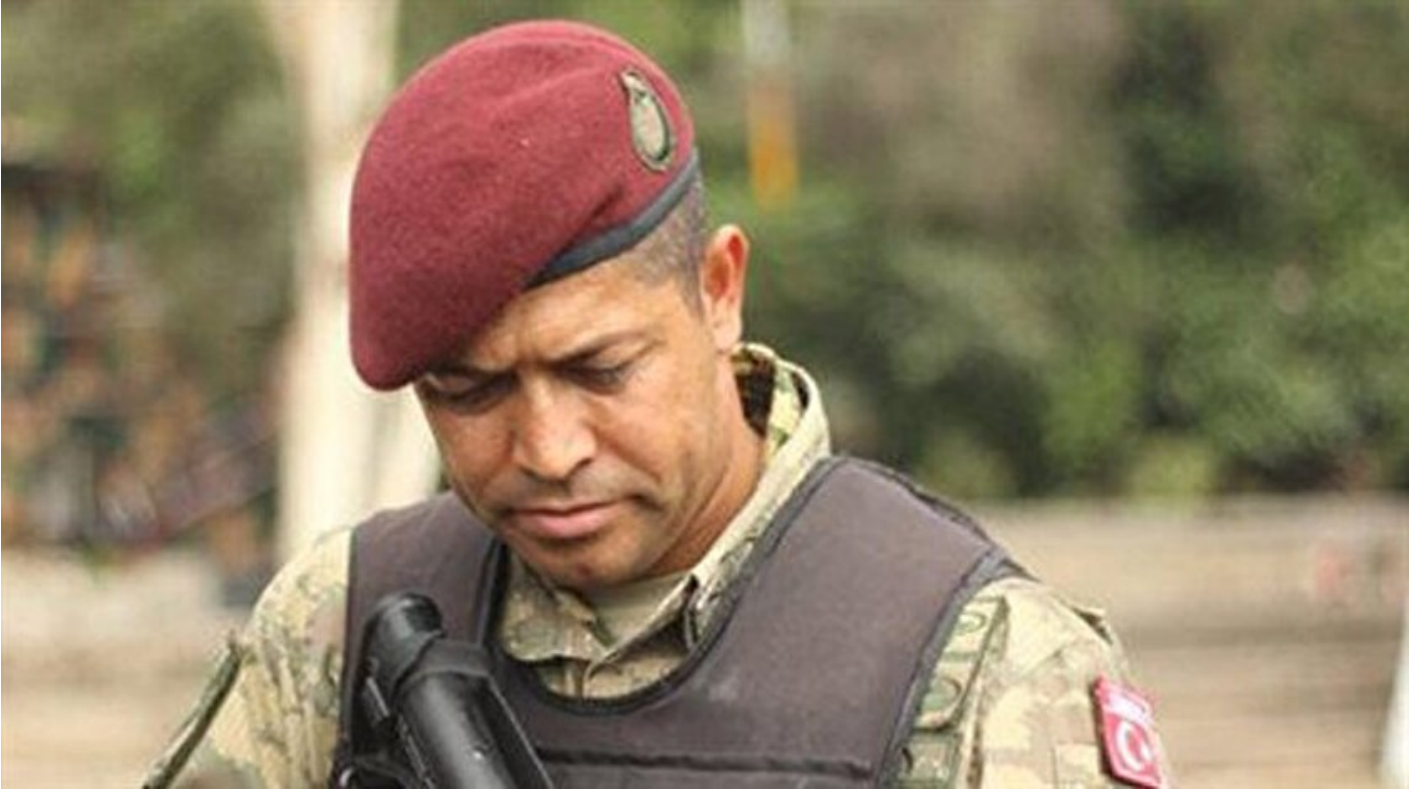
Şehit Ömer Halisdemir

Haber Merkezi · 17 Mayıs 2017, 04:00 · Son Güncelleme: 17 Mayıs 2017, 06:26 · Yeni Şafak