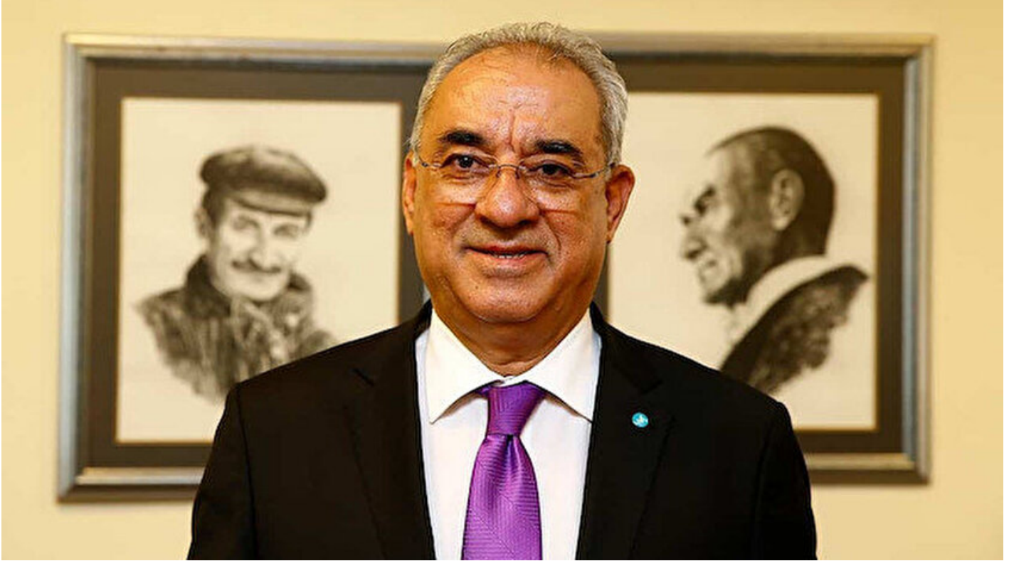
DSP Genel Başkanı Önder Aksakal.

Haber Merkezi · 16 Mayıs 2019, 10:50 · Son Güncelleme: 16 Mayıs 2019, 10:53 · Yeni Şafak