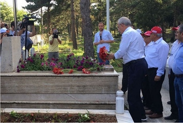
KILIÇDAROĞLU'NUN DOKTORUNDAN AÇIKLAMA