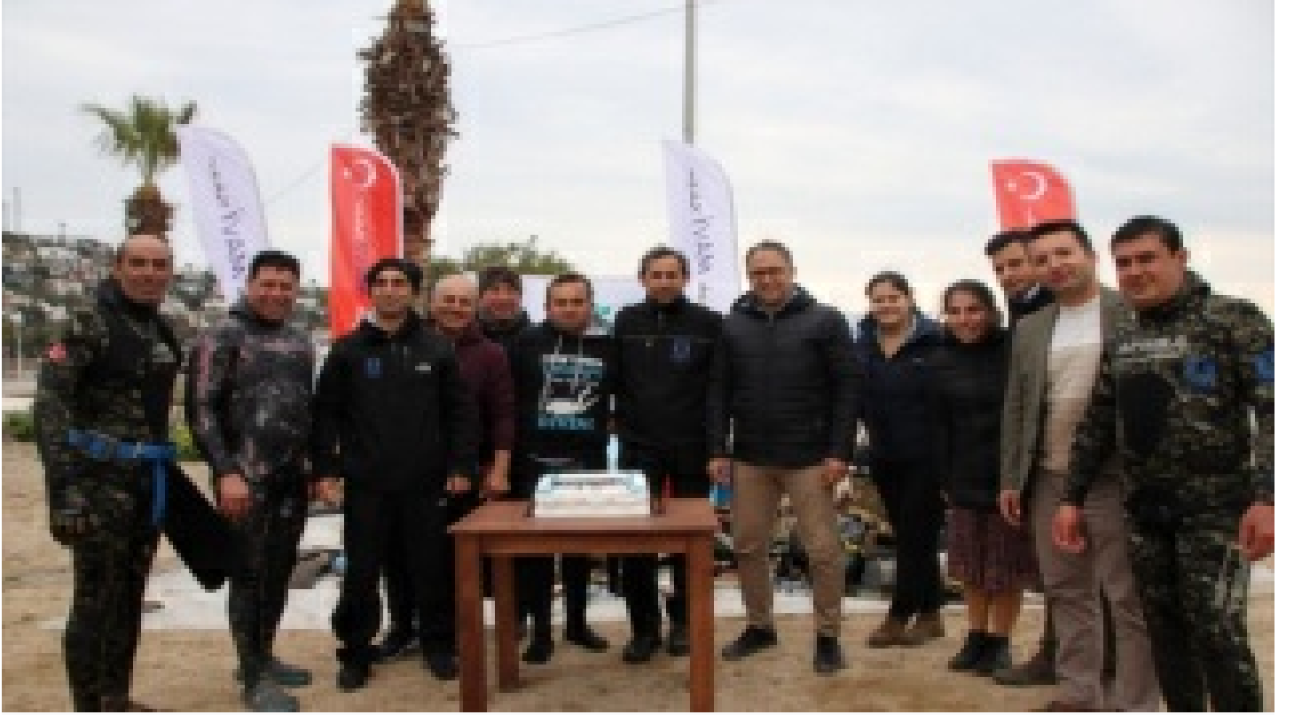
Dalgıçlar denizi, öğrenciler kıyıyı temizledi