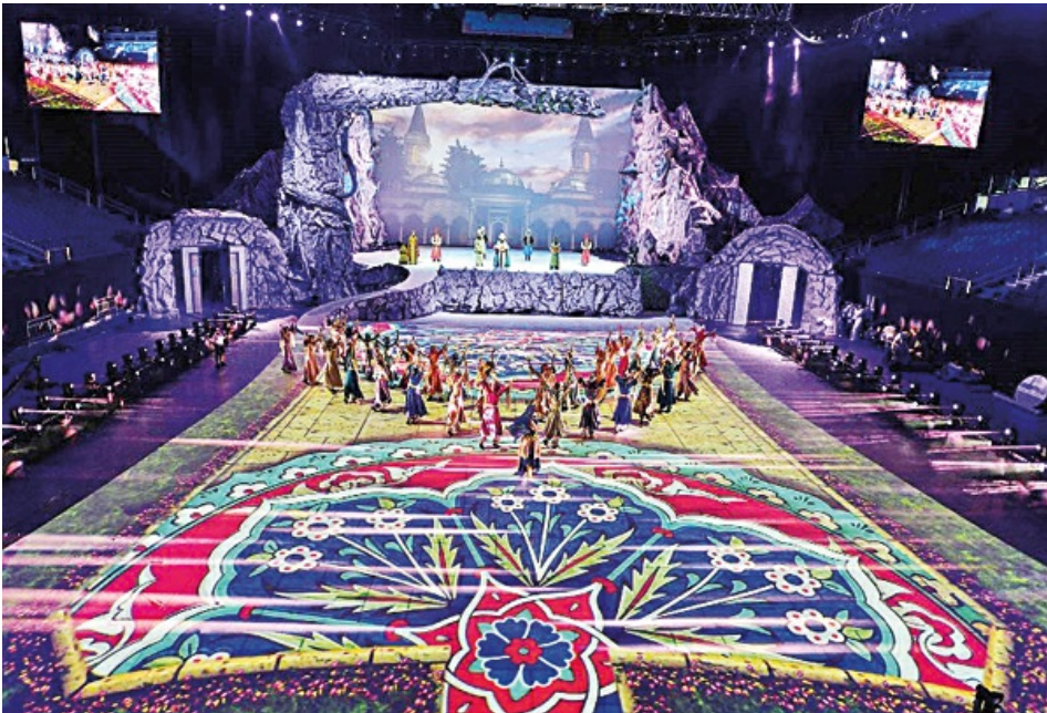
Türkçe artık onlara emanet

Bu yapı dünyanın birçok yerinde faaliyet yürüttüğü için biz kendimizi tanıttığımızda bize "Onlardan farkınız nedir" diye soruyorlar. Biz onlara 15 Temmuz'da yaptıklarını gösteriyoruz, o zaman farkımızı anlıyorlar. Böyle bir yapının dünyada bu kadar kendini gizleyebilmesi sadece Türkiye için değil diğer ülkeler için de büyük bir tehdit. Birçok ülkede devlet kurumlarıyla ilişkilerimizde zorluklar yaşıyoruz. Sonradan öğreniyoruz ki gördüğümüz kişiler onların okullarından mezun olmuş. Bütün amaçları bizi engellemek.