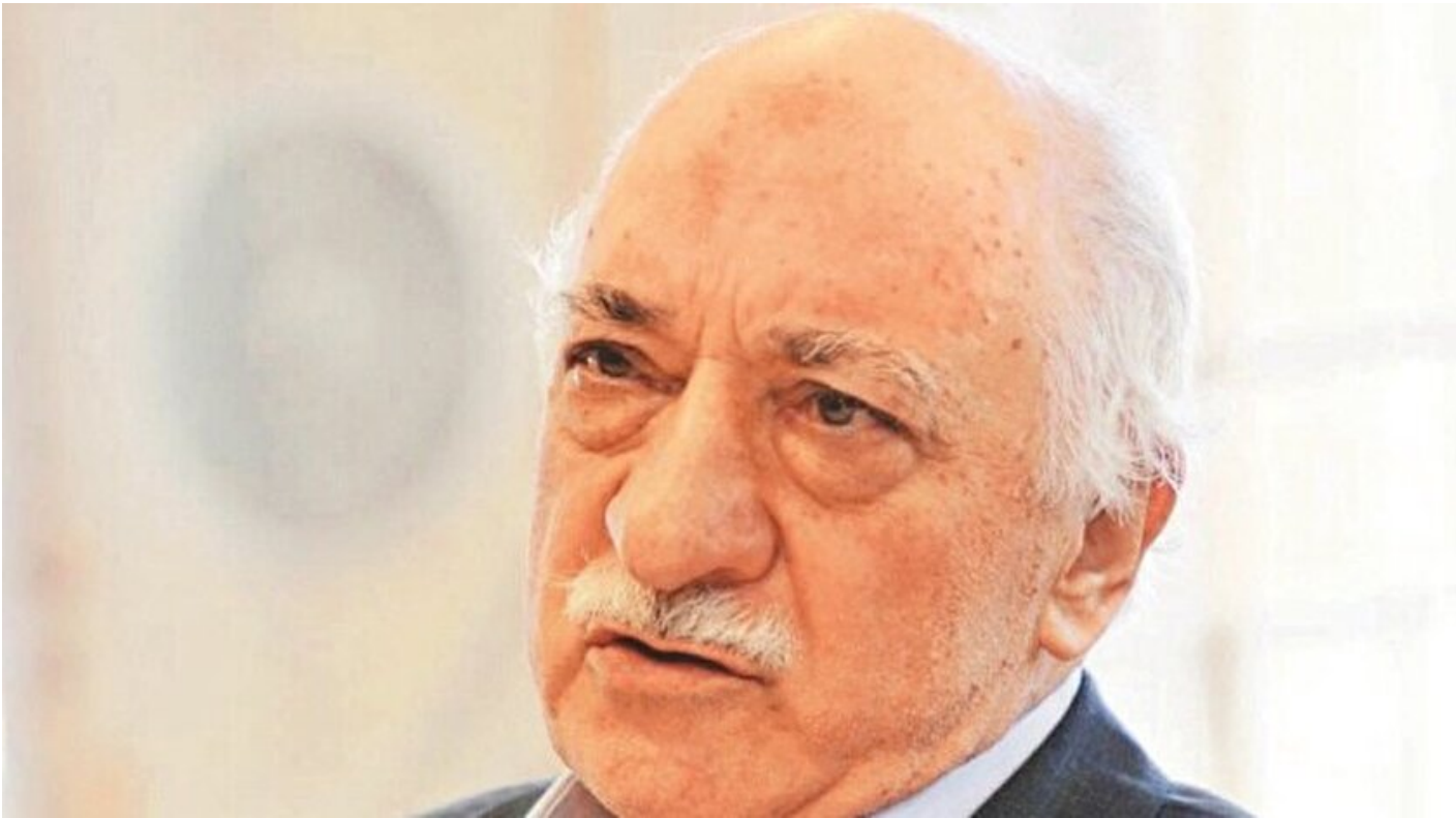
FETÖ elebaşı Fetullah Gülen