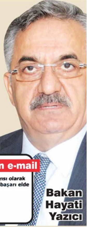
Bakan Hayati Yazıcı