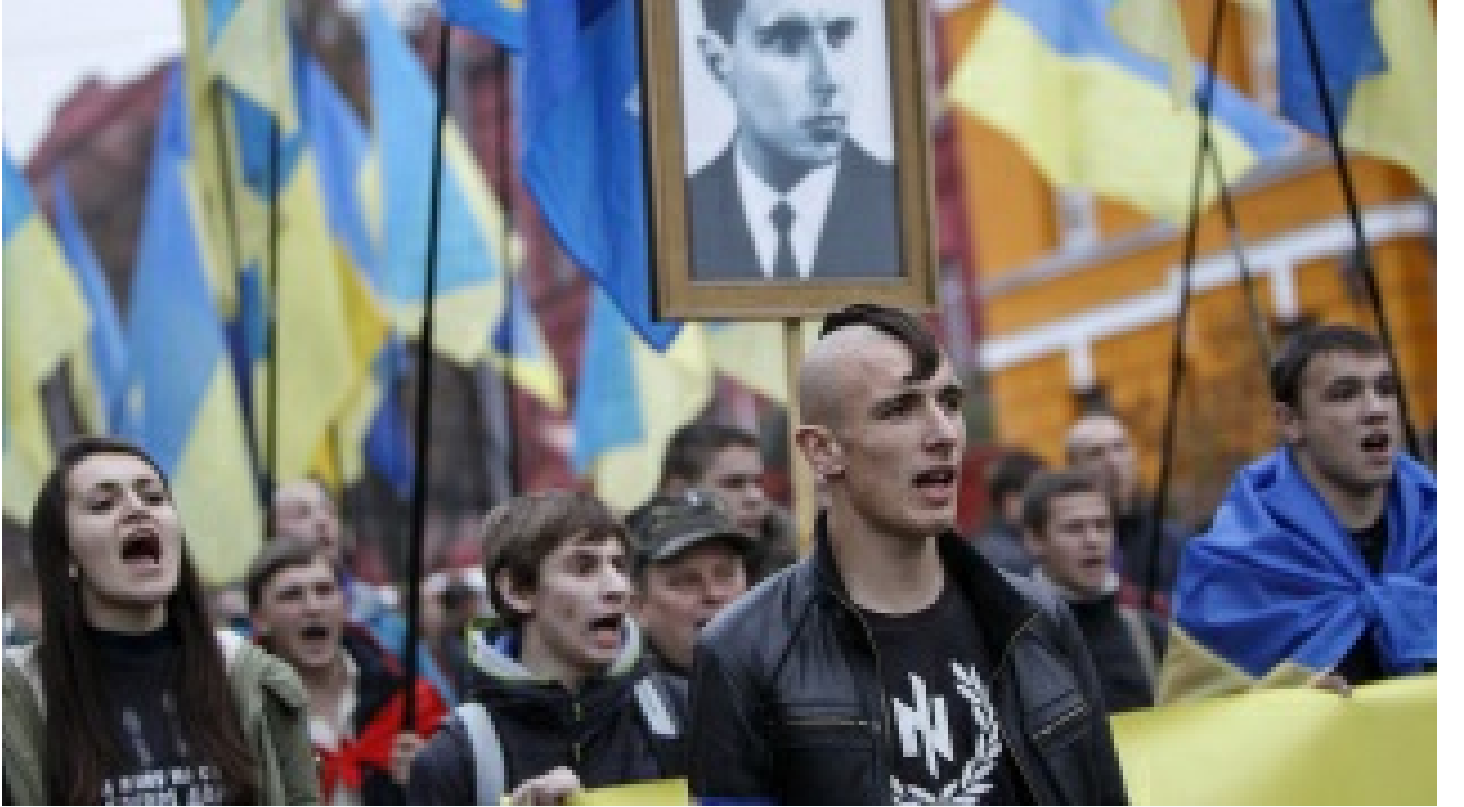
Ukrayna'da neo-Naziler binlerce kiŐiyi rehin aldı