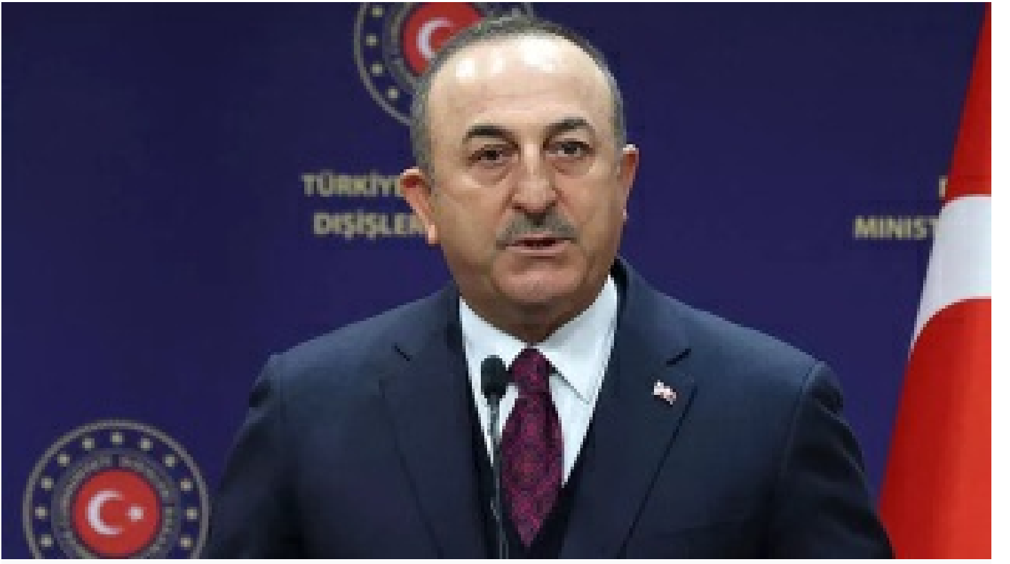
Çavuşođlu'dan Rusya ve Ukrayna bakanlarına "Antalya" teklifi