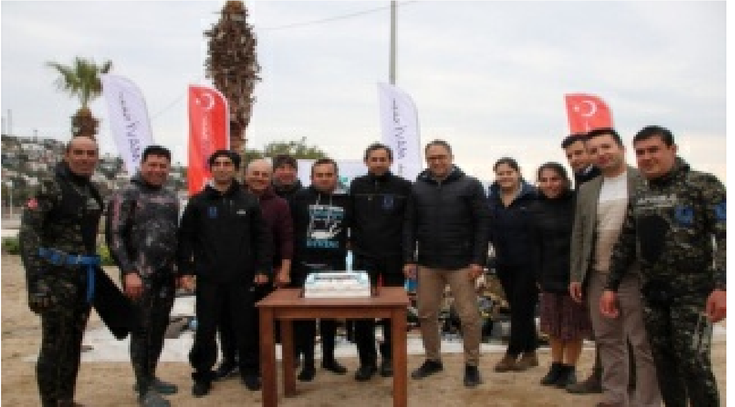
Dalgıçlar denizi, öğrenciler kıyıyı temizledi