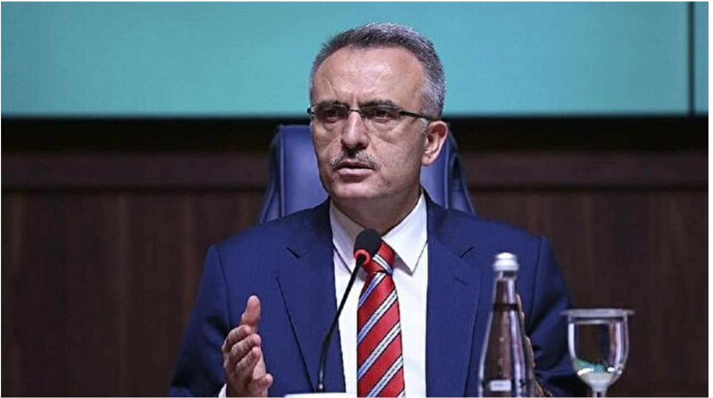
Maliye Bakanı Naci Ağbal

Haber Merkezi · 07 Ekim 2016, 12:30 · Son Güncelleme: 07 Ekim 2016, 14:23 · Yeni Şafak