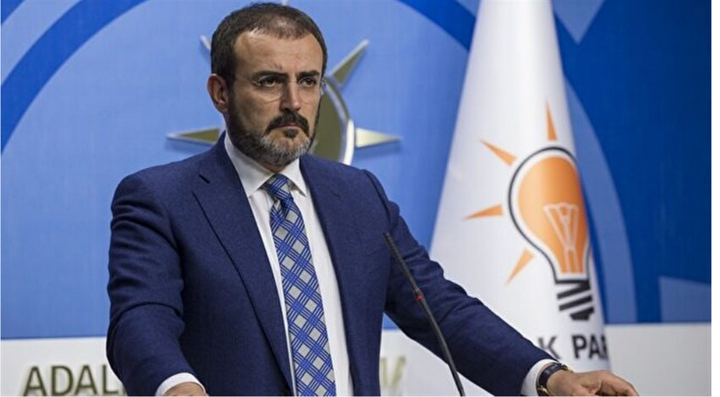
AK Parti Sözcüsü Mahir Ünal

Haber Merkezi · 12 Ekim 2017, 18:07 · Son Güncelleme: 12 Ekim 2017, 21:34 · IHA