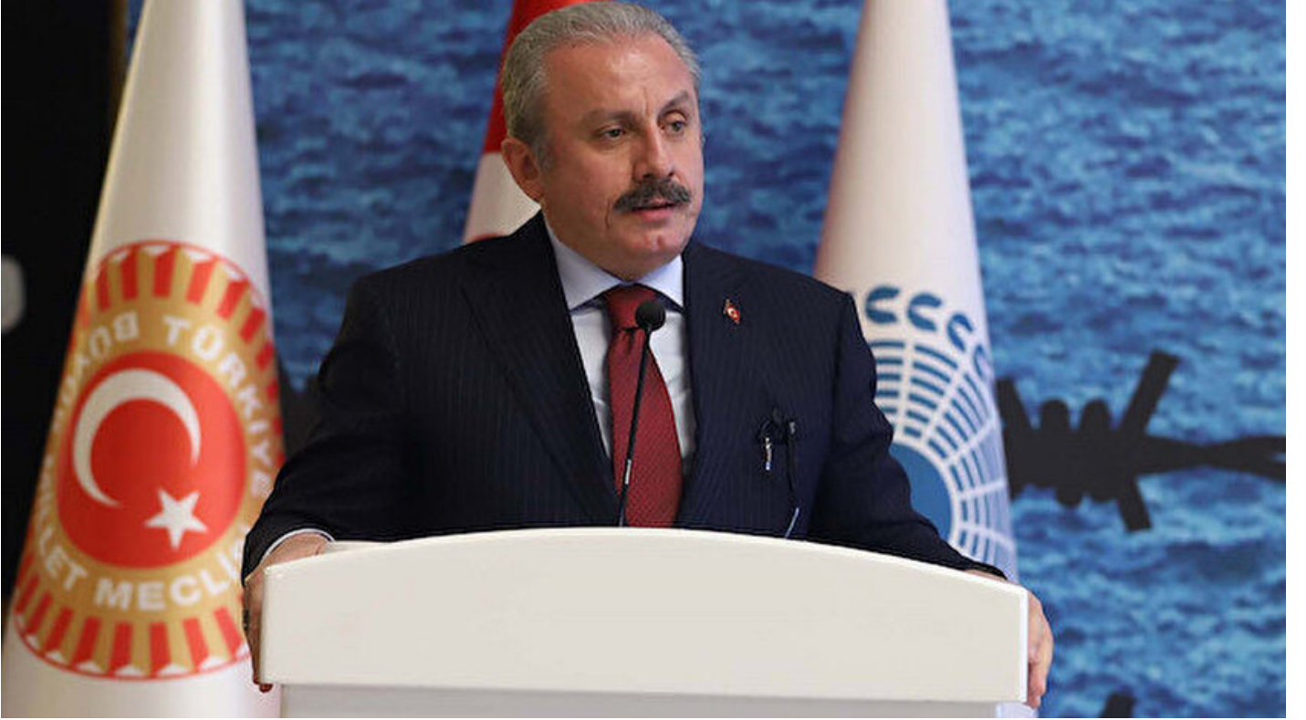
TBMM Başkanı Mustafa Şentop

Haber Merkezi · 22 Haziran 2019, 20:08 · Son Güncelleme: 22 Haziran 2019, 20:11 · AA