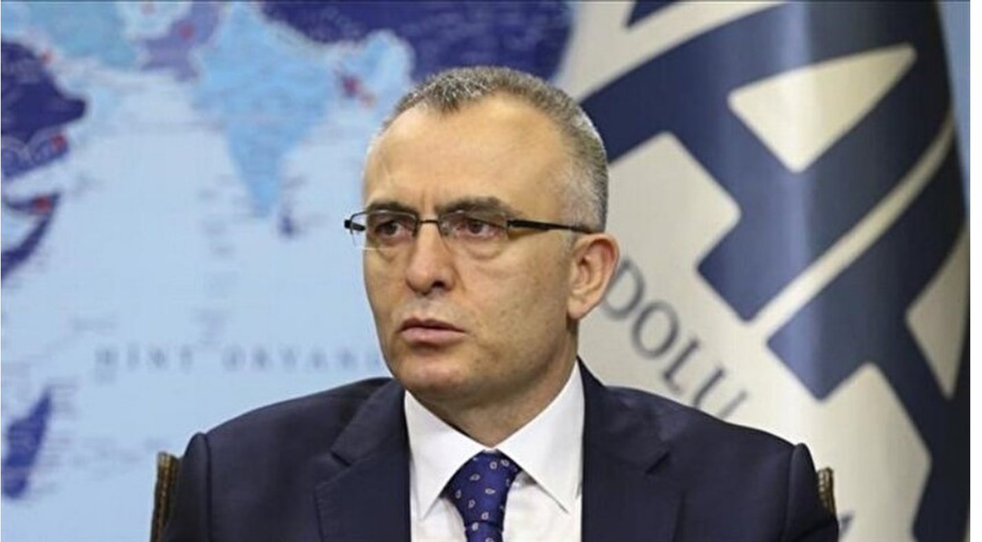
Maliye Bakanı Naci Ağbal

Haber Merkezi · 03 Ekim 2016, 13:40 · Son Güncelleme: 03 Ekim 2016, 13:47 · AA