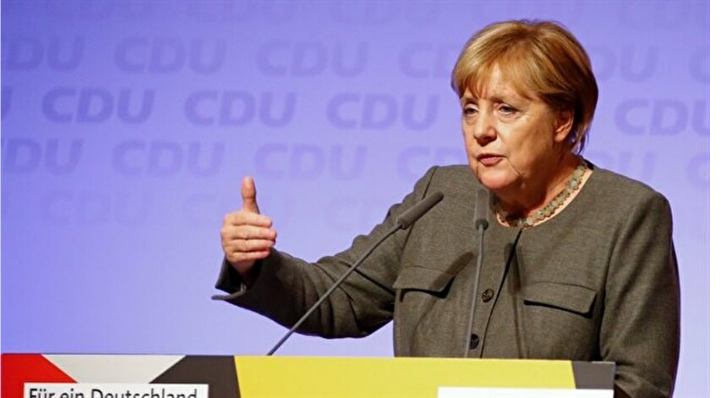
Almanya Başbakanı Angela Merkel

Haber Merkezi · 22 Eylül 2017, 10:35 · Son Güncelleme: 22 Eylül 2017, 11:03 · Yeni Şafak