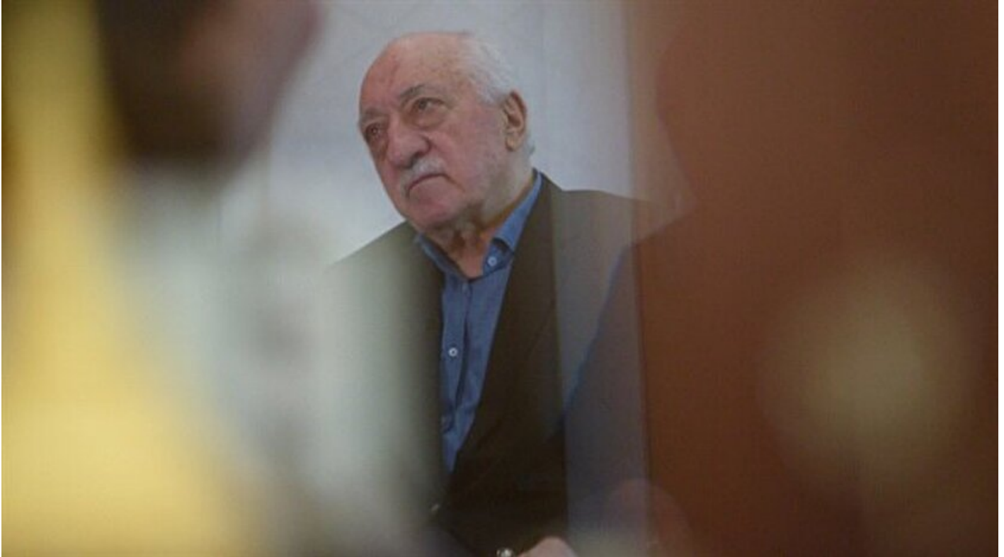
FETÖ elebaşı Fethullah Gülen

Haber Merkezi · 19 Aralık 2017, 08:54 · Son Güncelleme: 19 Aralık 2017, 17:48 · Diğer