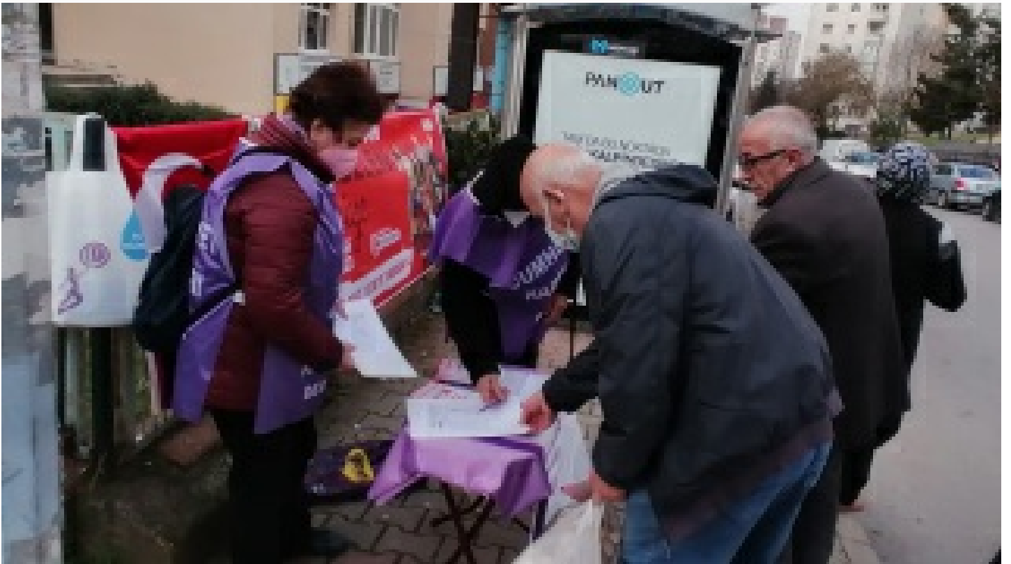
6 Mart'ta Tandoğan'da buluşuyoruz! Üretici kadınlar en önde