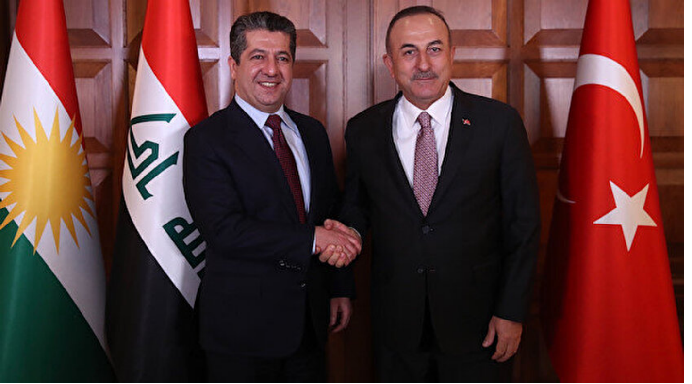
Dışişleri Bakanı Mevlüt Çavuşoğlu ve IKBY Başbakanı Mesrur Barzani.

Haber Merkezi · 28 Kasım 2019, 14:15 · Son Güncelleme: 28 Kasım 2019, 17:09 · AA