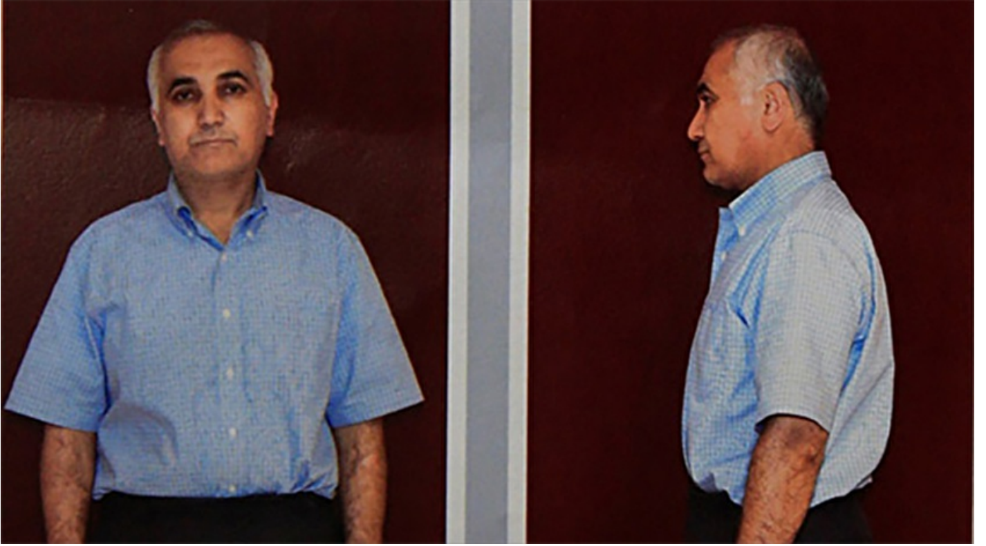
FETÖ'nün 'hava kuvvetleri imamı' Adil Öksüz

Haber Merkezi · 14 Ağustos 2016, 12:07 · Son Güncelleme: 14 Ağustos 2016, 12:22 · DHA