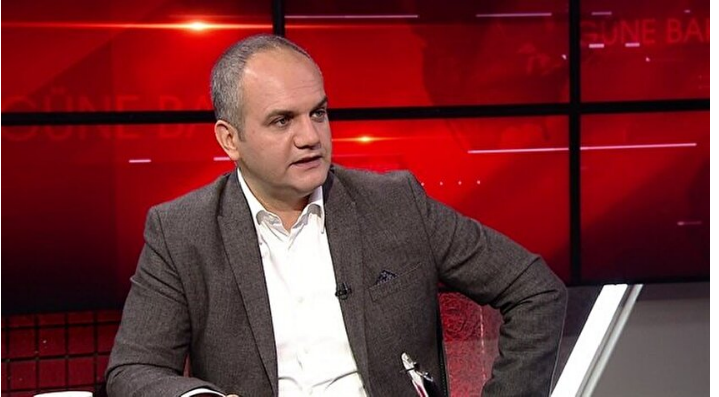
Firari gazeteci Tarık Toros

Haber Merkezi · 15 Mayıs 2017, 11:37 · Son Güncelleme: 15 Mayıs 2017, 11:42 · AA