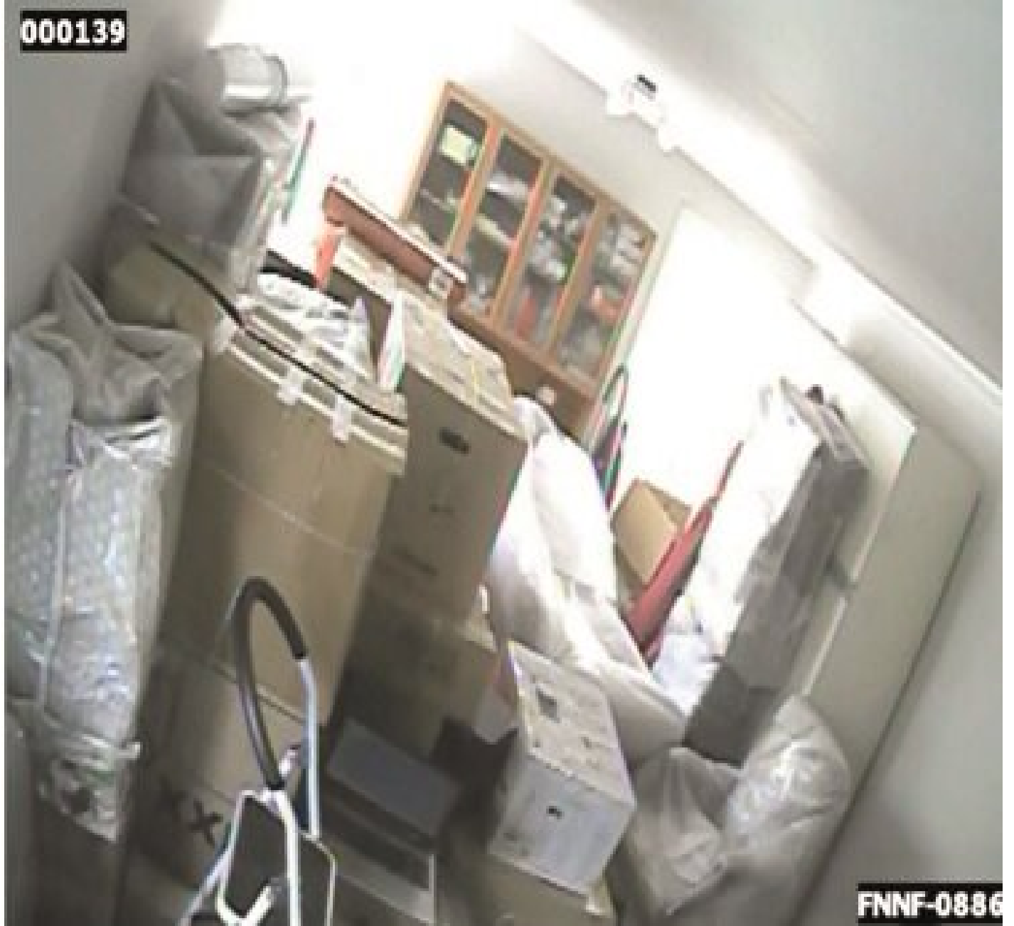
Polislerin çektiği görüntüler