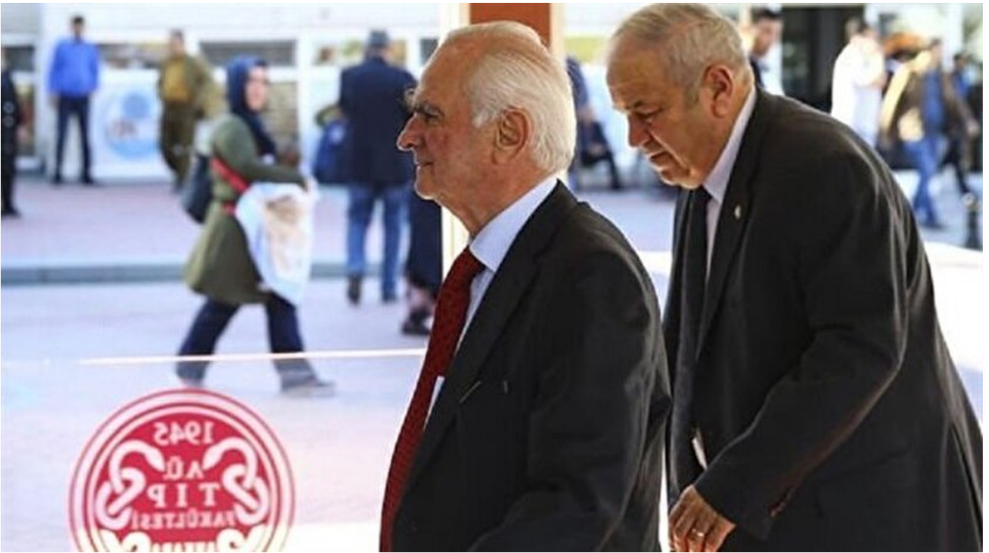
Eski CHP Genel Sekreteri Önder Sav

Haber Merkezi · 08 Ağustos 2018, 07:38 · Son Güncelleme: 08 Ağustos 2018, 07:43 · Diğer