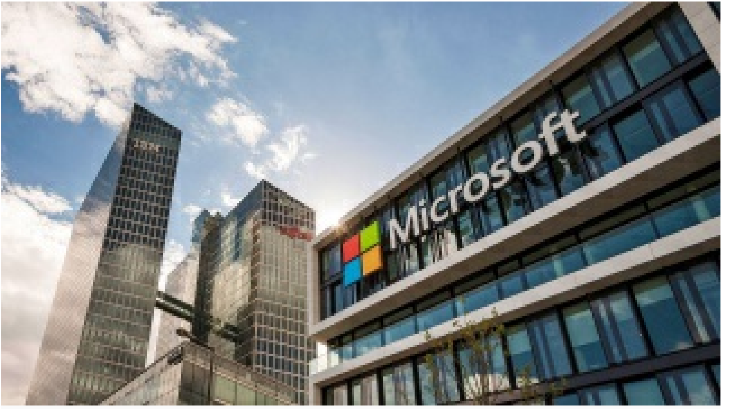
Microsoft, Rusya'da tüm hizmetlerini durdurdu