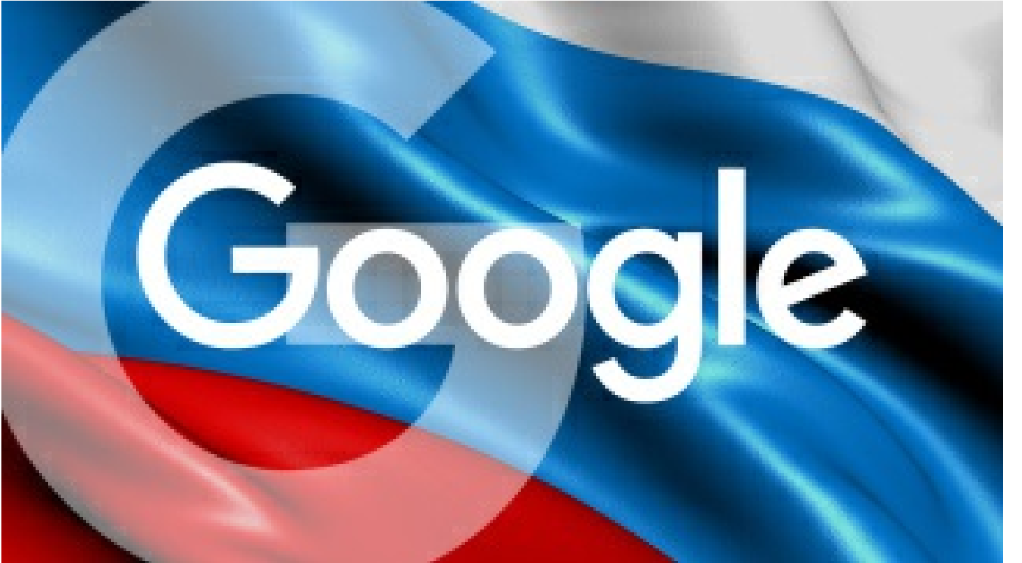
Google, Rusya'ya bir yaptırım daha uyguladı