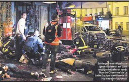
Saldırıların bir bölümü, Paris'in doğusunda bulunan La Belle Époque isimli binalarda meydana geldi.

PARİS'te keskin ateşin ölümlü saldırı, beş saat sürdü. En az 129 kişi hayatını kaybetti, 352 kişi yaralandı. Saldırı, 19 Ocak'ta başlatılan Paris saldırılarının bir parçası olarak değerlendiriliyor. 129 kişi öldü, 352 kişi yaralandı. Saldırı, 19 Ocak'ta başlatılan Paris saldırılarının bir parçası olarak değerlendiriliyor.