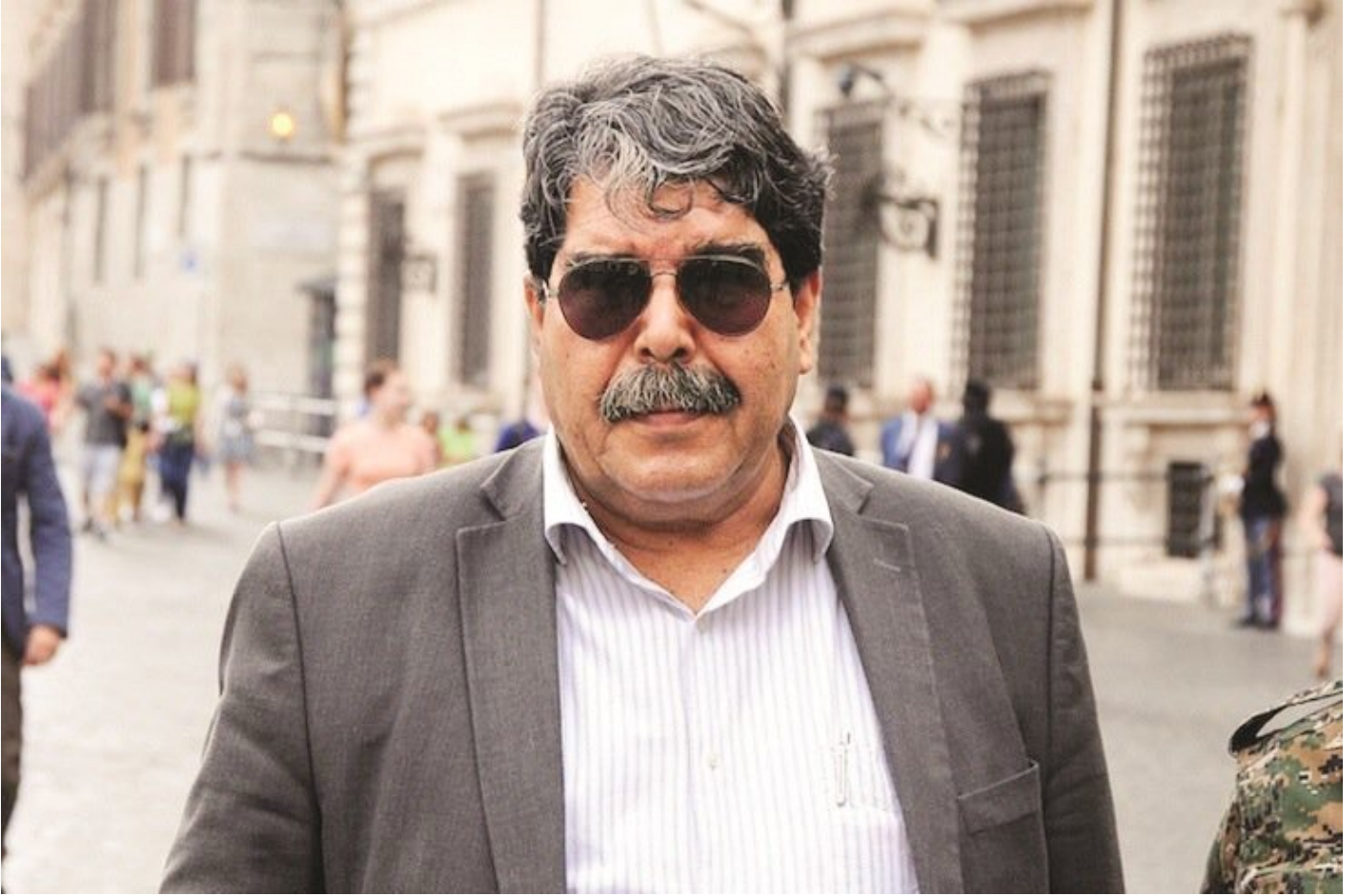
Suriye PKK'sını kurarak Türkiye sınırında terör kantonları oluşturan Salih Müslim

İsmi uzun süredir terörden arananlar listesinde kırmızı kategoride yer alan ve başına 4 milyon lira ödül konularak 'kırmızı bülten'le aranan Müslim için Ankara harekete geçti. Çekya Dışişleri ve Adalet Bakanlıkları ile temasa geçen Ankara, Müslim'in Türkiye'ye iadesi için hazırlanan kapsamlı dosyayı bugün Prag'a ileticek. Müslim, Ankara Merasim Sokak'ta 17 Şubat 2016'da meydana gelen saldırıda 29 vatandaşın yaşamını yitirdiği, 87 kişinin de yaralandığı terör saldırısının baş sorumluları arasında. Ankara 4. Ağır Ceza Mahkemesi'nce 'saldırının faili' sıfatıyla hakkında dava açılan Müslim'e 'devletin birliğini ve ülke bütünlüğünü bozma', 'nitelikli kasten öldürme', 'kasten öldürmeye teşebbüs', 'kamu malına zarar verme', 'mala zarar verme' ve 'tehlikeli maddeleri nakletme' gibi suçlar yöneltiliyor. Müslim ayrıca, 13 Mart 2016'da Ankara-Güvenpark'ta 36 kişinin ölümüne, 349 kişinin de yaralanmasına neden olan bombalı terör saldırısının da failleri arasında bulunuyor.