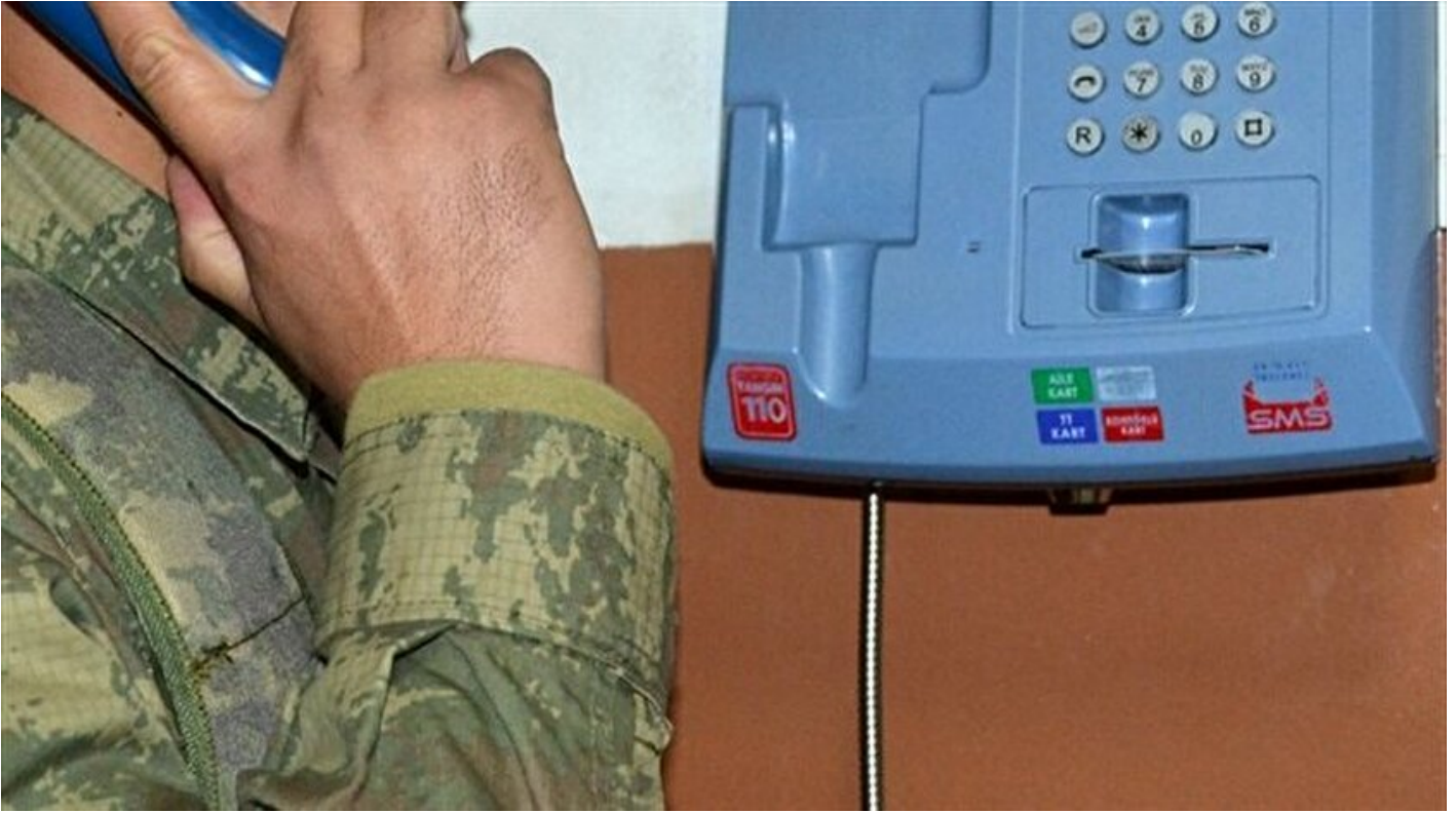
FETÖ'cülerin iletişim araçlarından biri: Ankesörlü telefon