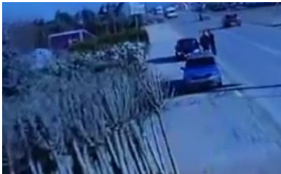
Kosova'daki MİT operasyonun görüntüsü ortaya çıktı

KOSOVO CUMHURBAŞKANI: HABERİM YOKTU... Kosova'da dün altı FETÖ'cünün Kosova polisi tarafından tutuklanması ve Türkiye'ye iade edilmesinin ardından, Kosova'da siyasiler birbirini suçlamaya başladı. Kosova Cumhurbaşkanı Haşim Taçi, tutuklamalarla ilgili bilgisinin olmadığını ve altı FETÖ'cünün tutuklamaların Kosova İstihbarat Ajansı - AKI ve İçişleri Bakanlığı ile Mülteciler Bürosu tarafından gerçekleştiğini söyledi. Cumhurbaşkanı Taçi, Türkiye Cumhuriyeti tarafından daha önceden bazı isimler gönderildiğini, ancak listede bu kişilerin olmadığını söyledi.