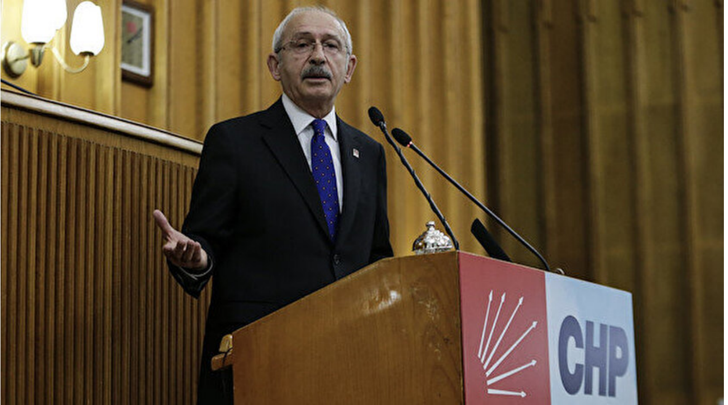
CHP lideri Kemal Kılıçdaroğlu