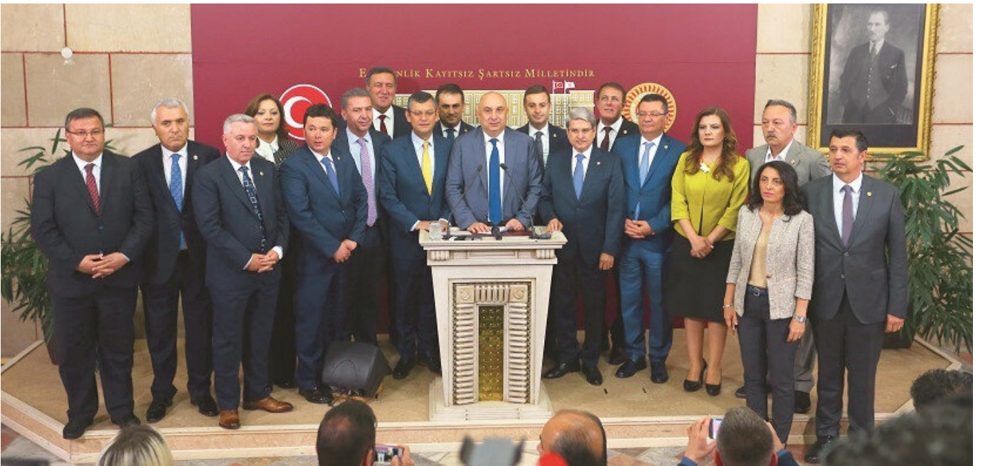
CHP, 2018'de İYİ Parti'ye yönelik planını devreye soktu. CHP'den 15 milletvekili istifa ederek, genel seçime katılıp koalisyoncu bir hükümetin İYİ Parti'ye katıldı. İYİ Parti'nin TBMM'de grup kurmasının önü açıldı.

Türkiye'deki Gezi kalkışmasının finansörleri arasında yer alan George Soros'un Açık Toplum Vakfı'nın Almanya uzantısı Friedrich Ebert Vakfı'nın davetlisi olarak Almanya'ya giden CHP Genel Başkanı Kemal Kılıçdaroğlu, skandal görüşme zincirine imza attı. Kılıçdaroğlu'nun Almanya'ya iner inmez ilk durağı FETÖ'den tutuklu eski milletvekili Eren Erdem'in ailesi oldu. Erdem'in eşi ve çocuğuyla bir araya gelen Kılıçdaroğlu'na kurmayları da eşlik etti. Kılıçdaroğlu'nun ikinci durağı ise PKK terör örgütünün destekçileri Sevim Dağdelen ve Evrim Sommer'le görüşmek oldu. Görüşme sonrası Türkiye'ye yönelik propaganda çalışmaları başladı.