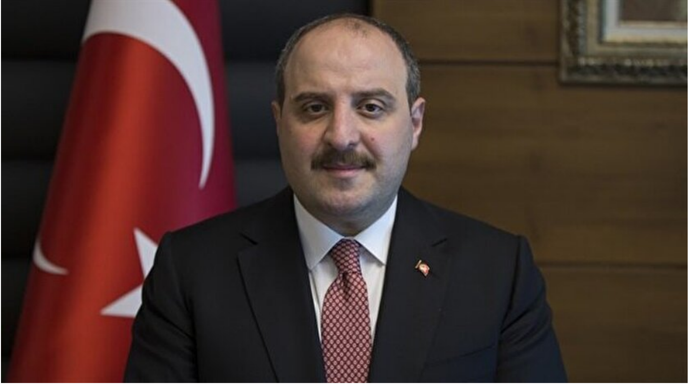
Sanayi ve Teknoloji Bakanı Mustafa Varank