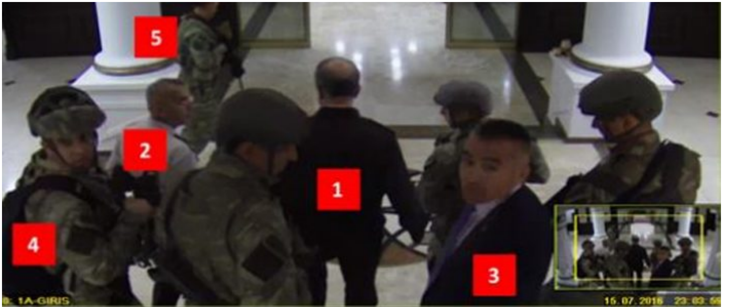
Hulusi Akar böyle götürülmüş.

Ankara Başsavcılığınca Genelkurmay Karargahında yaşananlara ilişkin yürütülen soruşturmada Yurtta Sulh Konseyi'nin, FETÖ'nün sivil imamlarınca belirlendiği kanaatine de varıldı. Savcılık, Konsey üyeleri belirlenirken, şüphelilerin, darbenin planlanmasında, organizasyonun sevk ve idaresinde, atama listelerinin ve darbe emirlerinin hazırlanmasında rolü ve etkinliğini dikkate aldı. Akıncı üssünde darbe bildirisinin provasını yapan Tümgeneral Kubilay Selçuk, Kuzey Deniz Saha Komutanlığı Kurmay Başkanı Ömer Faruk Harmancık, Akıncı Üssü Harekat Komutanı Albay Ahmet Özçetin de listede yer aldı. Orgeneral Akar ile Kuvvet Komutanlarını derdest eden isimlerden, Albay Orhan Yıkılkan, Özel kalem Müdürü Albay Ramazan Gözel, özel kalemde görevli Albay Osman Kılıç da listede bulunuyor.