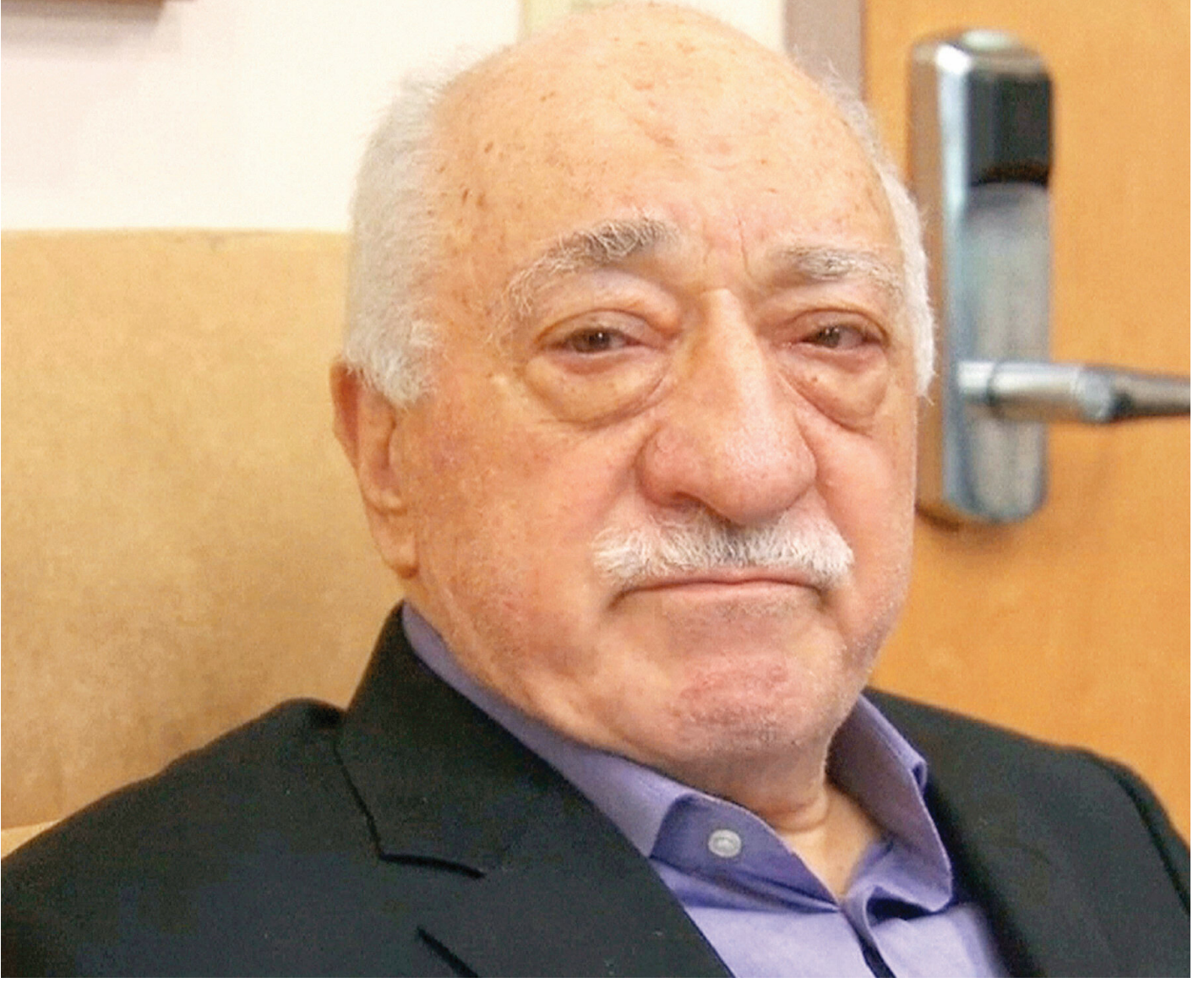
Teröristbaşı Fetullah Gülen