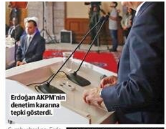
Erdoğan AKPM'nin denetim kararına tepki gösterdi.

Anayasa değişikliğinin Türk milletleri tarafından kabul edildiğini belirten Güven, "Evet oyu verenlerin sayısı 25 milyon 157 bin 463. Evet oyu verenlerin oranı yüzde 51,41. Hayır oyu verenlerin sayısı 23 milyon 779 bin 141 ve oranı 48,59 olarak gerçekleşmiştir" dedi. 15