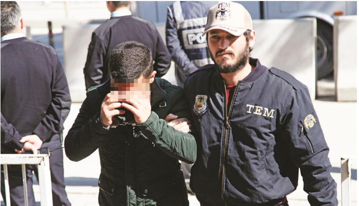
Dijital arşivde adı geçen 4 bin 762 polis imamı hakkında yakalama kararı verildi. 9 bin polis açığa alındı

FETÖ'nün emniyet imamı Kozanlı Ömer kod adlı Osman Hilmi Özdil'in adı, 17/25 Aralık FETÖ kumpasının planlayıcısı olarak duyuldu. Görünürde sigortacı olarak bilinen ve şirketiyle emniyetin araçlarını sigortalayan Osman Hilmi Özdil'in, Bankacılık Düzenleme Denetleme Kurulu'nda görevli banka murakıplarına, Cumhurbaşkanı Recep Tayyip Erdoğan'a yakın kişilerin şahsi ve şirket hesaplarını usulsüz şekilde incelemeye aldırıldığı ortaya çıkmıştı. Kurduğu gizli bağlantılar ortaya çıkmasın diye hakkındaki tüm belgeler yok edilen Kozanlı Ömer, deşifre olunca yurtdışına kaçmıştı. Kozanlı Ömer, 2007 yılında ABD'ye yaptığı ziyarette gözaltına alınmış ve FBI tarafından üzerinde çıkanlar arasında, içinde FETÖ operasyonlarını deşifre eden arşiv belgelerinin yer aldığı bir kart çıkmıştı.