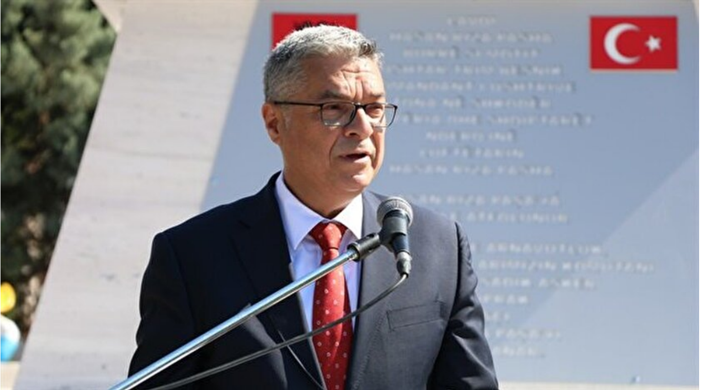
Türkiye'nin Tiran Büyükelçisi Hidayet Bayraktar

Haber Merkezi · 14 Mayıs 2017, 11:52 · Son Güncelleme: 14 Mayıs 2017, 11:58 · AA