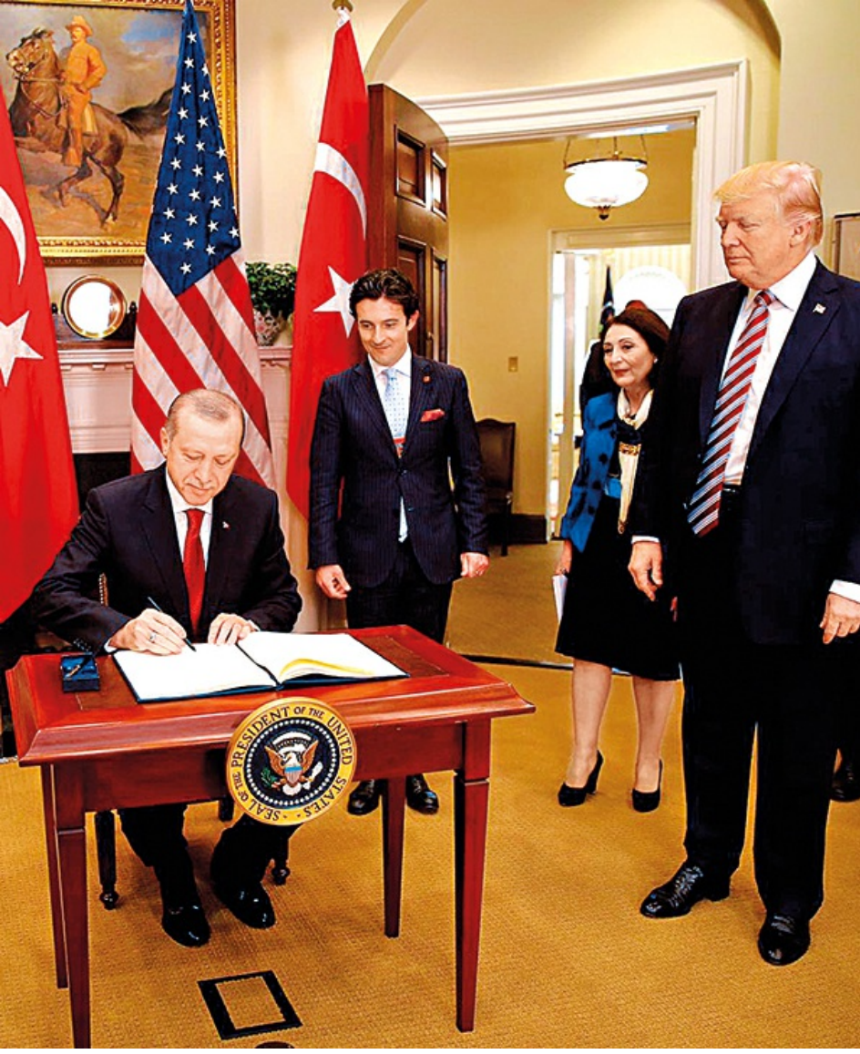
Cumhurbaşkanı Recep Tayyip Erdoğan Beyaz Saray'ın Şeref Defterini imzaladı.