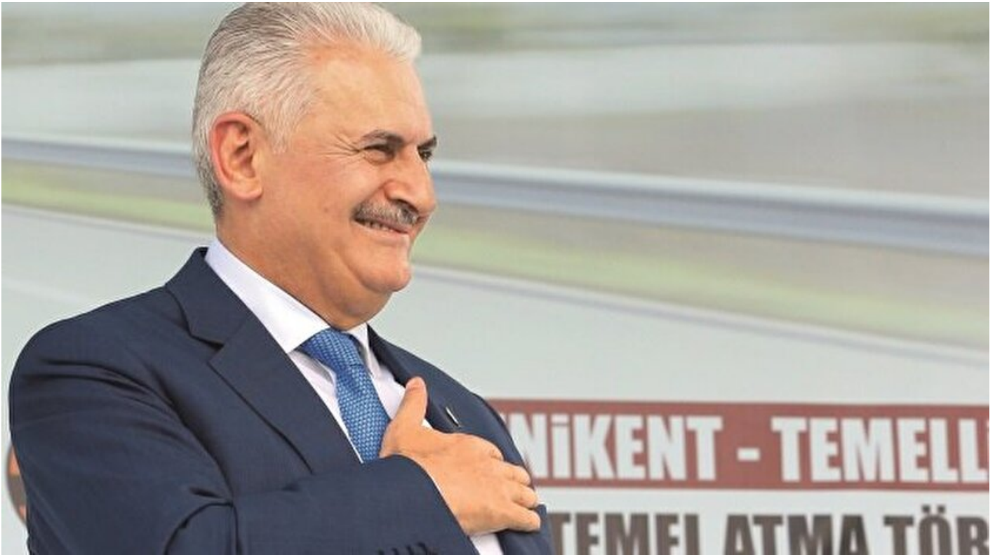
Başbakan Binali Yıldırım