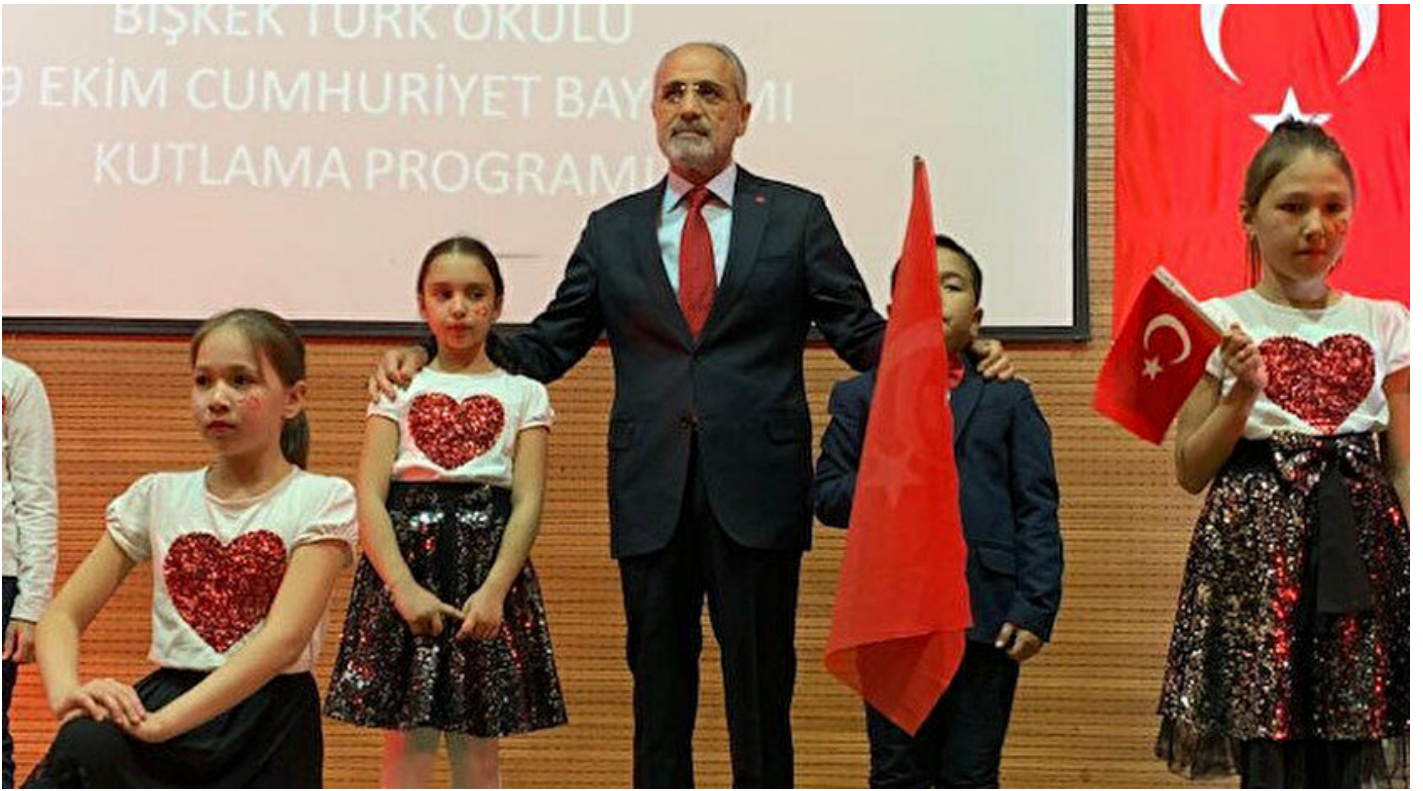
Cumhurbaşkanı Başdanışmanı Yalçın Topçu

Haber Merkezi · 30 Ekim 2019, 09:02 · Son Güncelleme: 30 Ekim 2019, 09:50 · Yeni Şafak