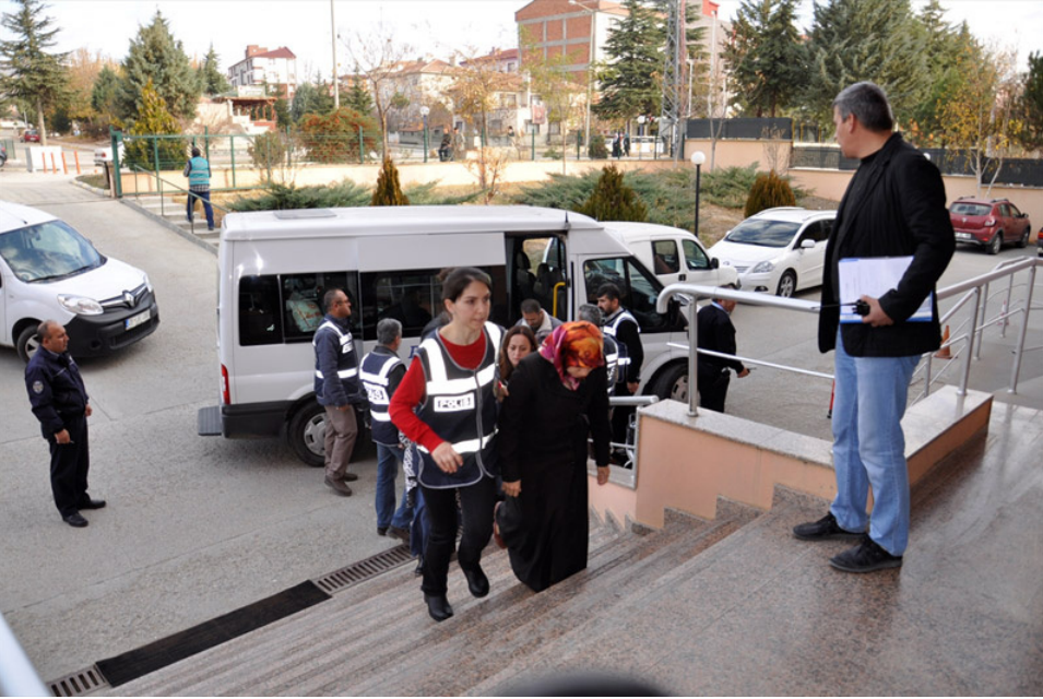
Amasya merkezli bir diğer

büyük FETÖ operasyonu ise İstanbul, Kocaeli, Ankara, Burdur, Düzce, Manisa, Mardin, Ordu ve Merzifon'da gerçekleşti.