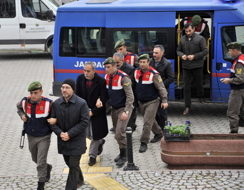
Öğretmen oldukları ve daha