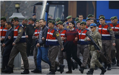
Erdoğan'a suikast yapacaklardı bu halde hakim karşısına çıktılar