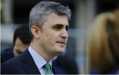
Erdoğan'ın avukatı açıkladı bu davanın emsali yok

FETÖ elebaşı Fetullah Gülen'in "bir numaralı" sanık olarak yer aldığı iddianamede, 3'ü firari 44'ü tutuklu 47 sanığın "Cumhurbaşkanına suikast", "anayasayı ihlal", "yasama organına karşı suç", "hükümete karşı suç", "silahlı terör örgütü yöneticisi olma", "yerine getirdiği kamu görevi nedeniyle kasten öldürme", "yerine getirdiği kamu görevi nedeniyle kasten öldürmeye teşebbüs etme", "kasten öldürmeye teşebbüs", "zincirleme şekilde cebir ve tehdit kullanarak kişiyi hürriyetinden yoksun kılma", "neticesi sebebiyle ağırlaşmış yaralama", "zincirleme şekilde silahla tehdit", "Cumhurbaşkanına hakaret", "zincirleme şekilde kamu görevlisine görevi nedeniyle hakaret", "kamu malına zarar verme", "mala zarar verme", "nitelikli olarak konut dokunulmazlığının ihlali" ve "nitelikli yağma" suçlarından cezalandırılmaları isteniyor. Saldırığı gerçekleştiren FETÖ'nün "suikast timi"ndeki biri firari 37 asker için en az 6'şar kez ağırlaştırılmış müebbet talep ediliyor.