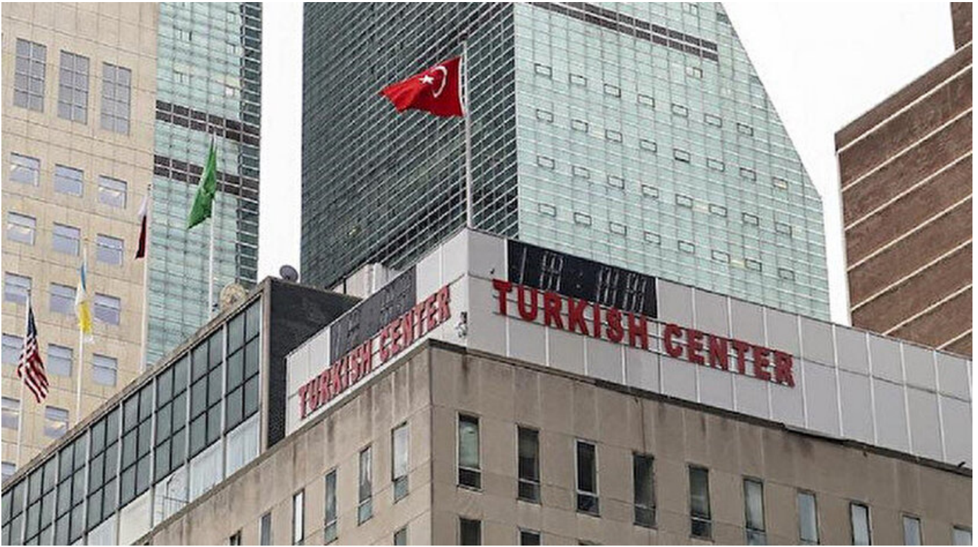
New York'taki Türk Başkonsolosluğu