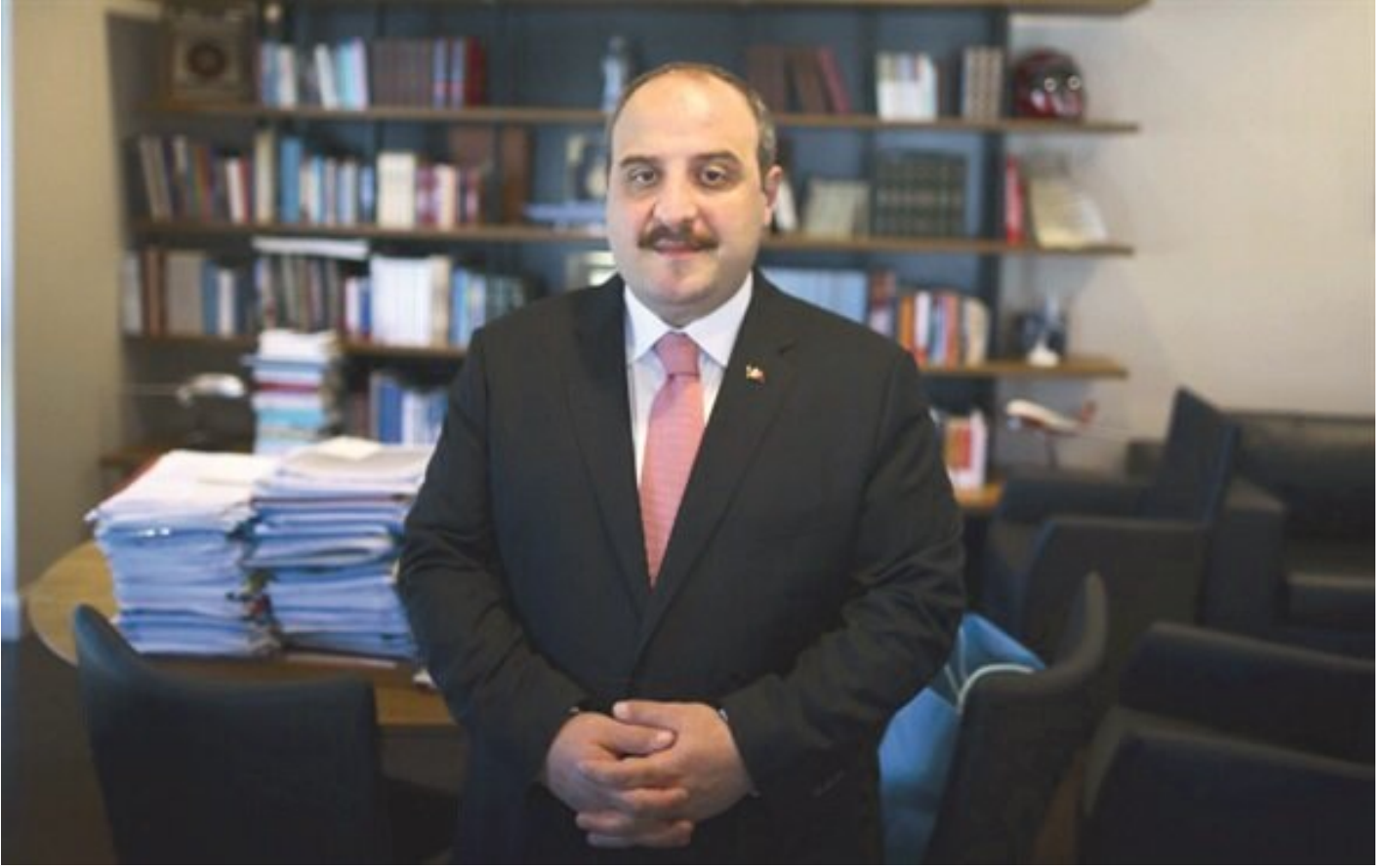
Sanayi ve Teknoloji Bakanı Mustafa Varank

gövdasını siper etmesi sayesinde alçak darbe girişimi durduruldu" ifadelerini kullandı.