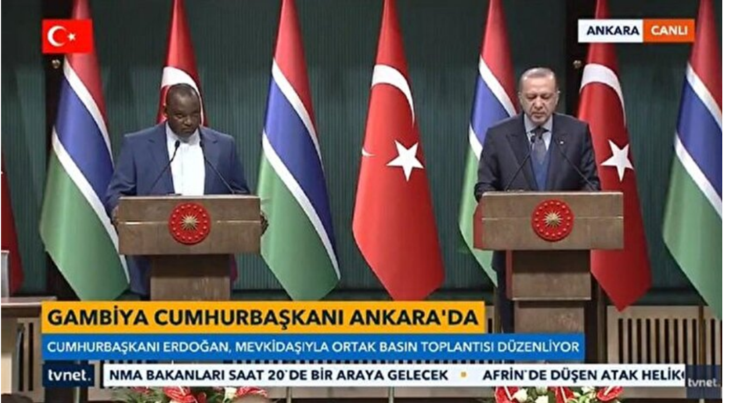
Cumhurbaşkanı Erdoğan ile Gambiyalı mevkidaşı Adama Barrow

Haber Merkezi · 14 Şubat 2018, 19:27 · Son Güncelleme: 14 Şubat 2018, 19:39 · Yeni Şafak