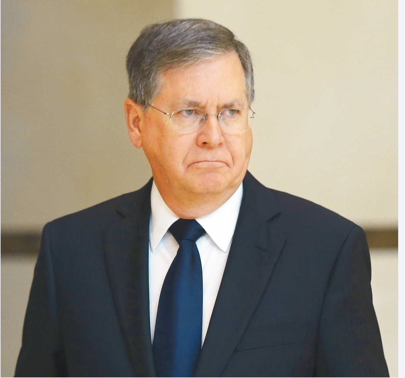
ABD Büyükelçisi David Satterfield