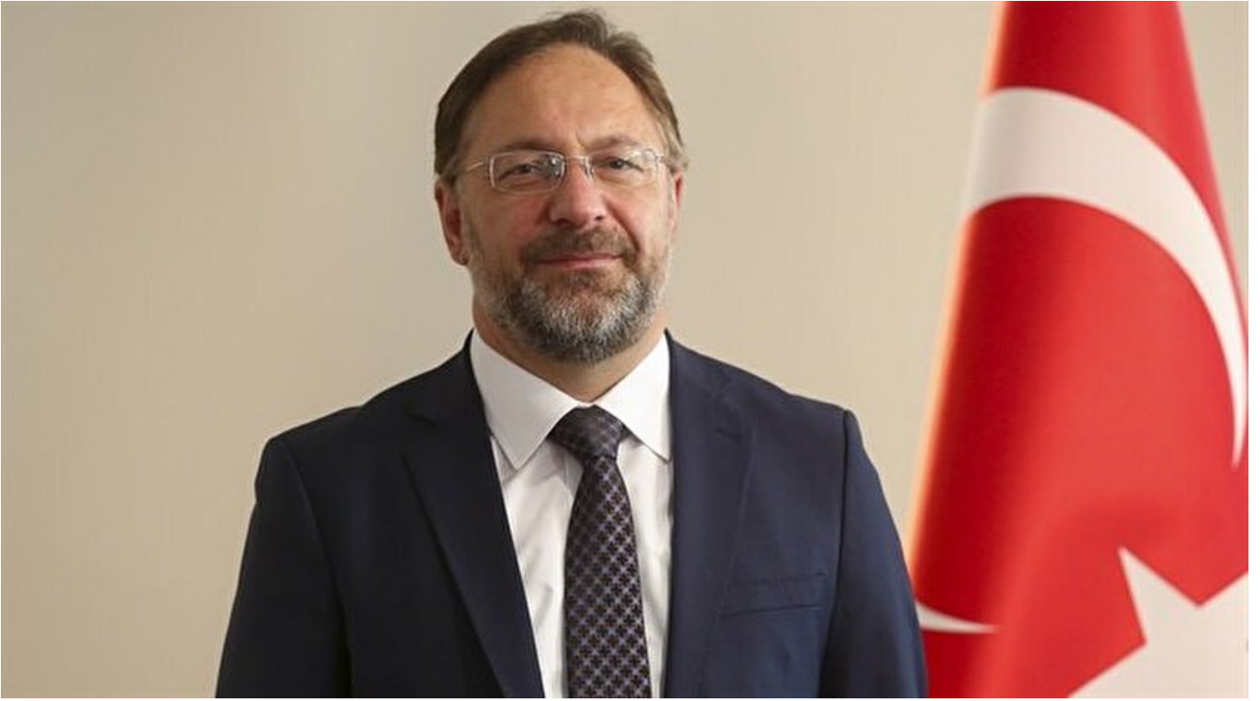
Diyanet İşleri Başkanı Ali Erbaş

Haber Merkezi · 17 Eylül 2017, 09:32 · Son Güncelleme: 17 Eylül 2017, 09:42 · Yeni Şafak