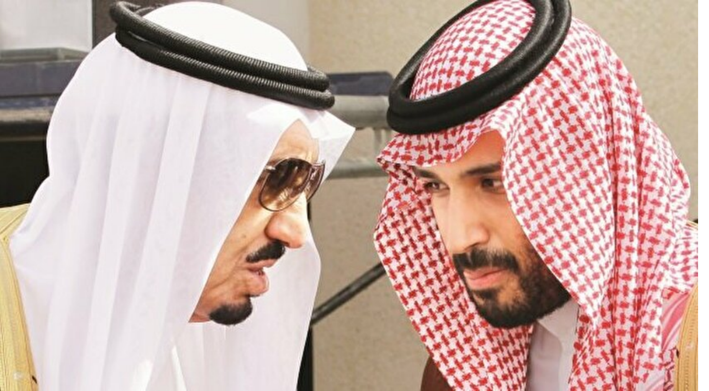
Selman bin Abdülaziz - Muhammed bin Selman

Haber Merkezi · 14 Aralık 2017, 04:00 · Yeni Şafak