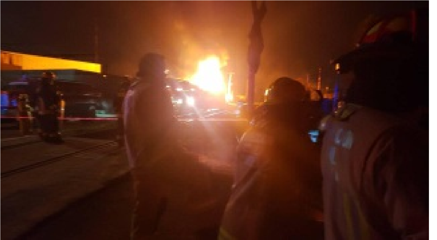
Dolmabahçe Sarayı'nda yangın!